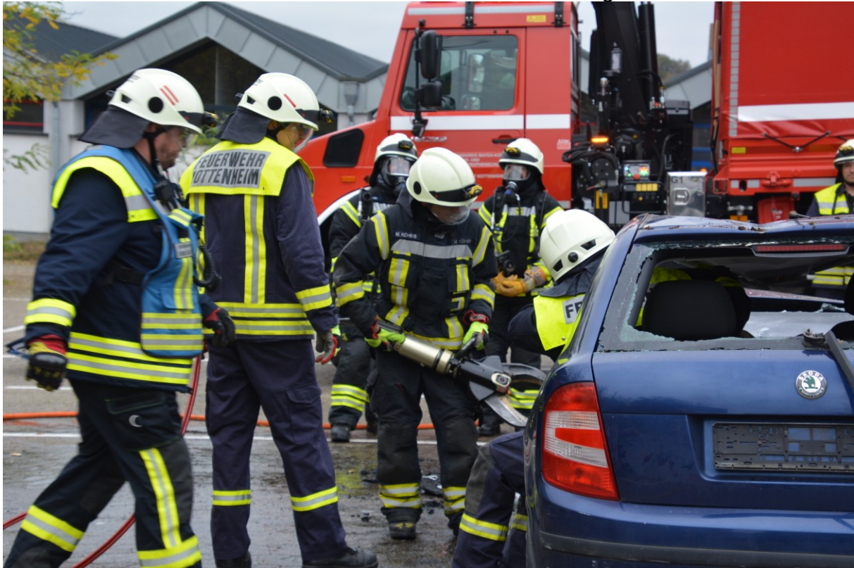
Bild 3, Personenrettung mit der Rettungsschere.

Im Nachgang sprach der Wehführer die Gäste auf die Arbeit bei der Feuerwehr an und lud alle Interessierten zwischen 16 und 67 Jahren ein, bei der Feuerwehr vorbei zu schauen und sich dort ehrenamtlich zu engagieren. Jeder Mensch zählt wenn es drauf an kommt.