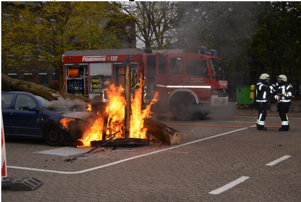
Bild 1. Übungsszenario beim Eintreffen der Feuerwehr

Am Samstag, den 02.11.2024 gegen 15:00Uhr wurde die Bevölkerung durch Sirenegeheul aufgeschreckt.